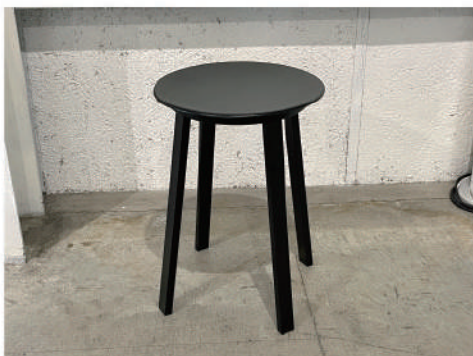
⑫ 回転イス low