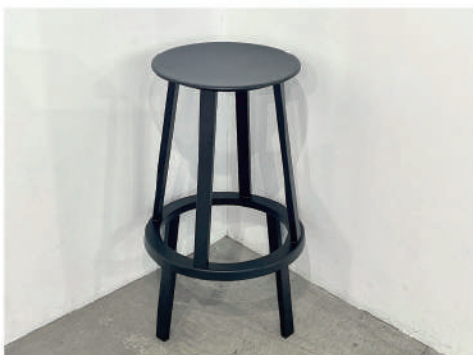
⑬ 回転イス medium