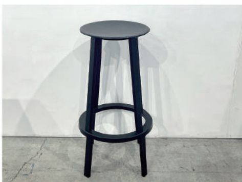
⑭ 回転イス high