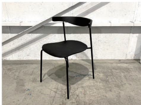
⑧ スタッキングチェア