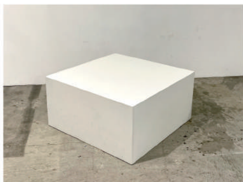
⑯ 白ボックス什器 大